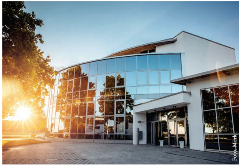
Von der Projektentwicklung mit eigenen Architekten über die Planung der intralogistischen Prozesse bis hin zur schlüsselfertigen Bauausführung: eine typische Referenz im Industriebau für die Mörk GmbH & Co. KG

➤ Aufrichtigkeit, Zuverlässigkeit, Kompetenz